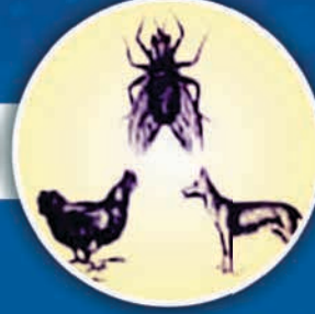
જંતુ અને પાલતું પ્રાણીઓ