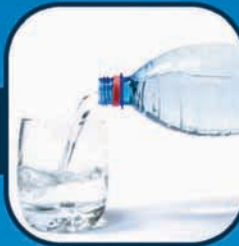
ચોખ્ખા પાણીના સ્રોતોનો યોગ્ય ઉપયોગ કરો