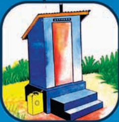
સંડાસનો ઉપયોગ કરવાથી