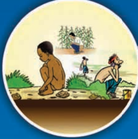
ખુલ્લામાં મળ ત્યાગ