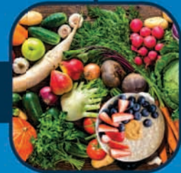
સ્વચ્છ, તાજાં અને ટાંકેલા ખોરાકનો ઉપયોગ કરો.