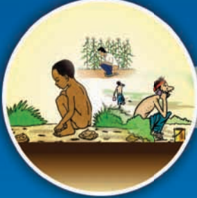
ખુલ્લામાં મળ ત્યાગ