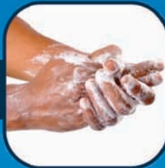
હાથને સાબુથી સારી રીતે ધુઓ