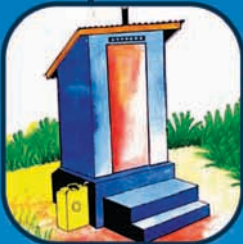
સંડાસનો ઉપયોગ કરવાથી