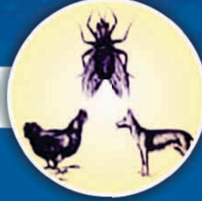
જંતુ અને પાલતું પ્રાણીઓ