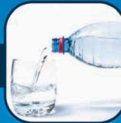
ચોખ્ખા પાણીના સ્રોતોનો યોગ્ય ઉપયોગ કરો