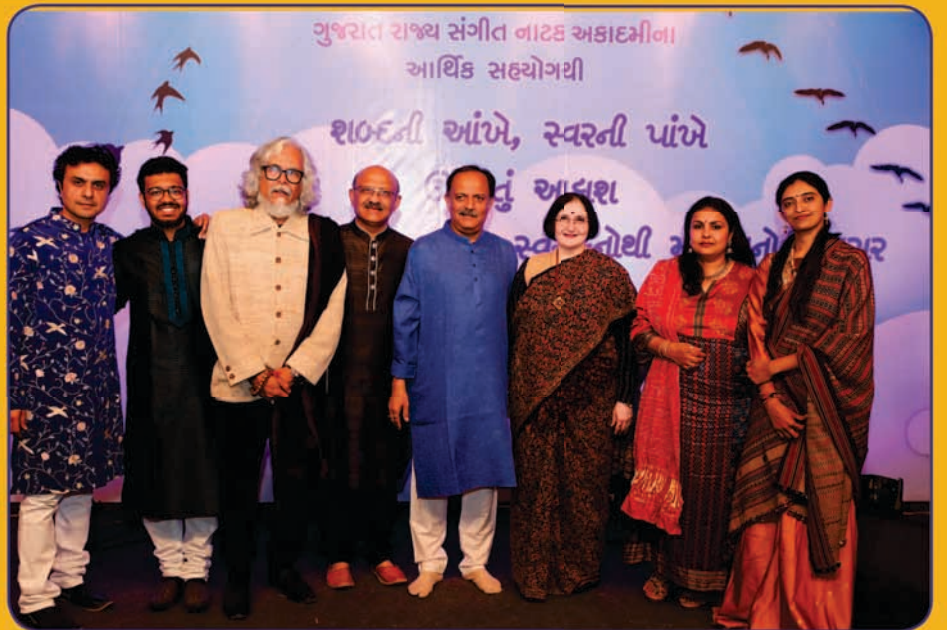
'શબ્દની આંખે, સ્વરની પાંખે' ઉઘડતું આકાશ 'સ્વસ્તુ'નો વિશિષ્ટ કાર્યક્રમ