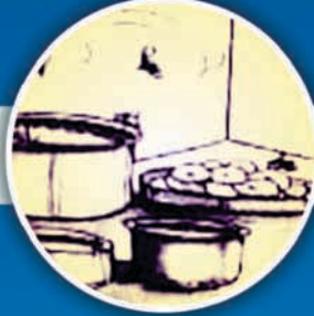
દૂષિત ખાદ્ય પદાર્થ